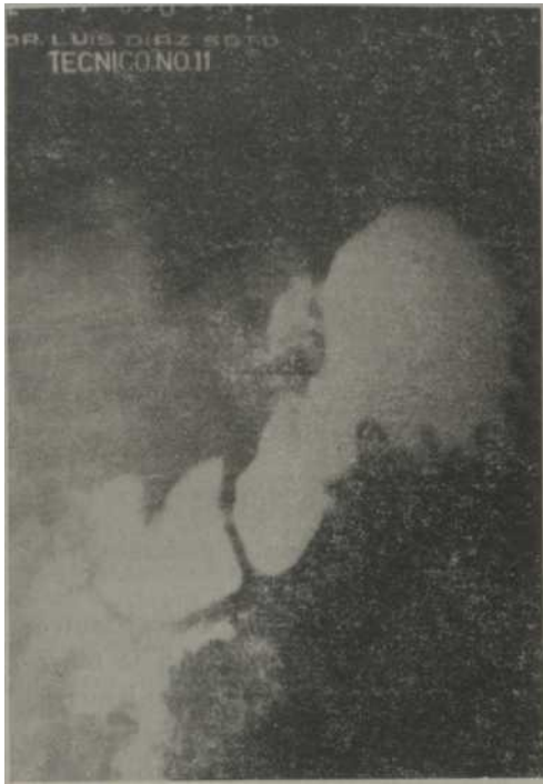
Fig. 1. Estudio radiológico de un paciente con la técnica llamada "Standard" en fluoroscopia del estómago en cascada sin otra alteración.