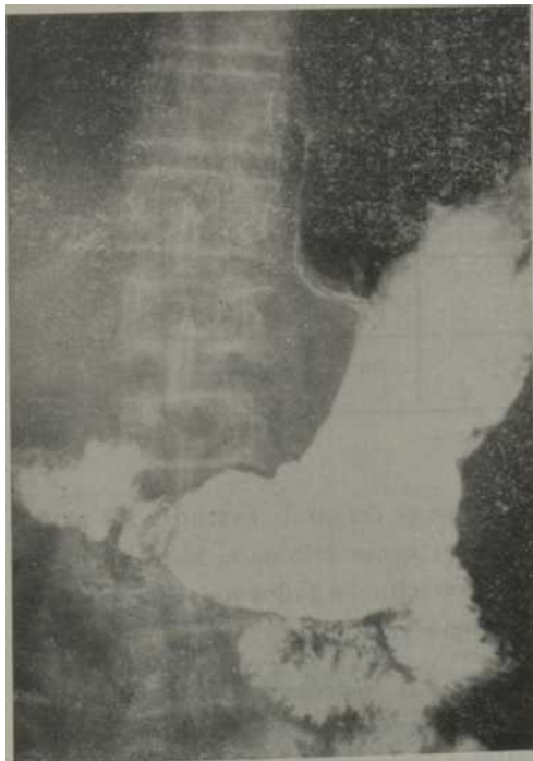
Fig. 3. Paciente ingresado en el Servicio de Medicina Interna del Hospital Militar "Dr. Luis Díaz Soto", por úlcera gástrica, a los 25 días de estar en tratamiento se le hace gastroscopia y se visualiza una úlcera callosa en curvatura menor.