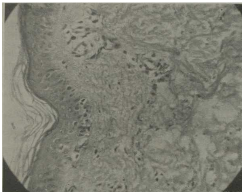
Fig. 2. Iliopsia realizada en el sitio de la prueba correspondiente a un paciente con el diagnóstico de lupus eritematoso sistematizado.

(***) No se incluyen 5 casos en la Prueba de Friedman modificada por no poder establecerse la comparación con la preparación de Células L.E., por no haberse realizado dicha prueba en esos casos. Aclaremos también que de esos sujetos con lupus eritematoso crónico discoide reaccionaron positivos a la Prueba de Friedman modificada.