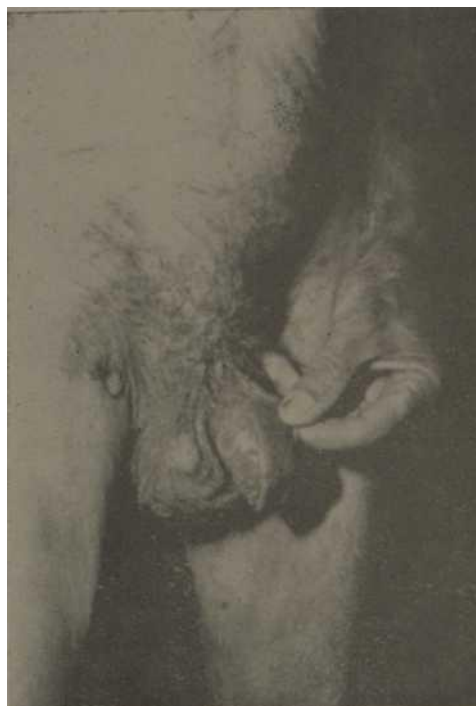
Fig. 8.—Adíese dos ampollas en piel del escroto y una más en región inguinal.