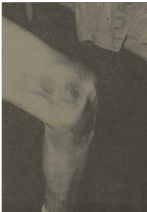
Fig. 9.—Ampolla grande, flúcida, en región de la rodilla.