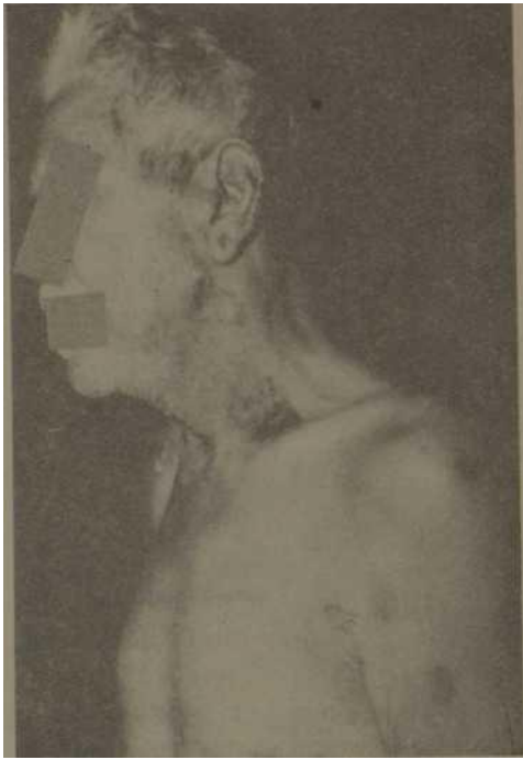
Fig. 1: Obsérvese el oscurecimiento del pelo canoso descrito en esta afección, así como las ampollas diseminadas por el cuerpo las cuales han sido tratadas y cortadas con las tijeras.