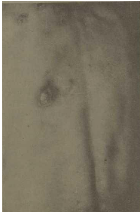
Fig. 3: Numerosas ampollas de variados tamaños localizadas en la espalda, ya tratadas y cortadas.