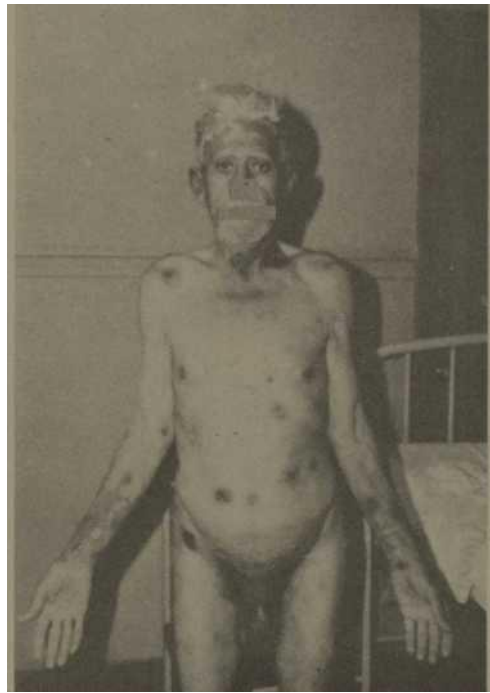
Figs. 4, 5 y 6.—Véase la generalización de las ampollas y su parecido con el Pénfigo Vulgar.