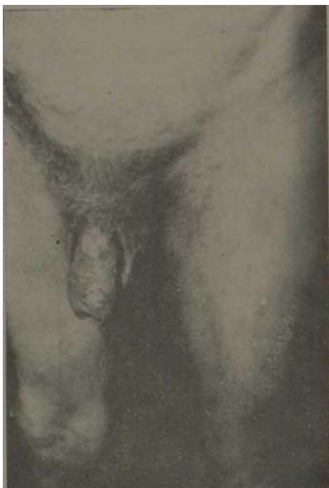
Fig. 7.—Obsérvese dos ampollas de gran tamaño en piel del prepucio.