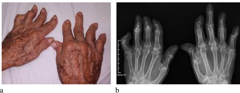
Fig. 1 - Artritis mutilante de ambas manos.

Se presenta en las imágenes una artritis psoriásica grave y deformante. Aproximadamente el 5 % de las personas con artritis psoriásica tienen este tipo de artritis. La artritis psoriásica mutilante por lo general afecta las manos y los pies. También puede causar dolor en el cuello y la espalda baja (fig. 1 y 2).