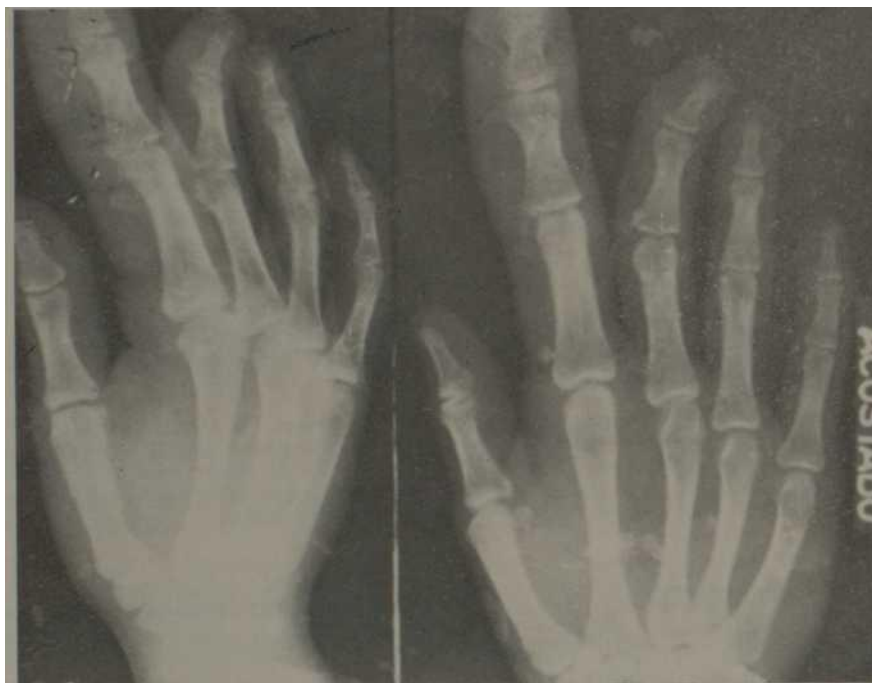
Fig. 1.—Gigantismo de huesos y partes blandas del segundo dedo de la mano derecha. En el estudio radiológico se aprecia el mayor tamaño relativo del segundo metacarpiano y de todas las falanges, así como de las partes blandas correspondientes.

Dado el estado psíquico de la paciente, se decide efectuar la intervención quirúrgica. Los datos referentes a la misma serán presentados en otro trabajo.