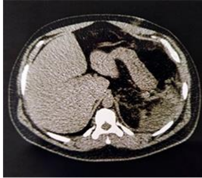
Fig. 3 - Imagen de tomografía abdominal sin contraste que muestra colección a nivel de la celda esplénica.

La fiebre fue otra complicación que estuvo en relación con un absceso subfrénico izquierdo que se evacuó en una segunda intervención quirúrgica (fig. 3).