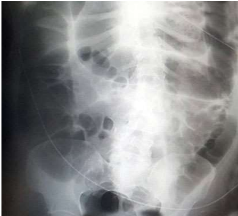
Fig. 3 - Rayos X de abdomen en la que se evidencia dilatación del colon.

Debido a daño técnico, el hospital no contaba con el servicio de tomografía abdominal, por lo que no se pudo observar el aumento de volumen a nivel de colon.