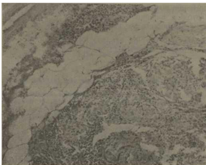
Figura 5 Tejido conectivo de la cápsula de la glándula tiroides con varios granulomas (H y E X 10).