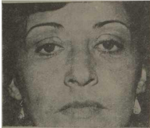
Figura 1 Obsérvese la presencia de placas amarillentas alrededor de ambos ojos compatibles con xantelasma.

Examen físico (datos positivos): paciente con lesiones propias de psoriasis en miembros superiores e inferiores. Disminución de la agudeza visual. Presencia de placas amarillentas alrededor de ambos ojos, compatibles con xantelasma (figura 1). Se constata engrosamiento de los Tendones de Aquiles, por xantomias a ese nivel (figura 2). El resto del examen físico es negativo.