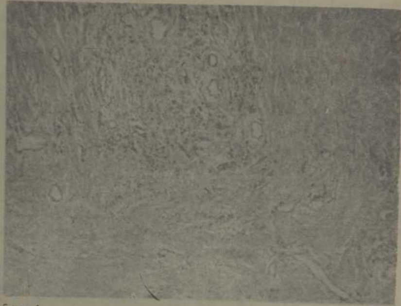
Figura 4. Carcinoma escirroso.