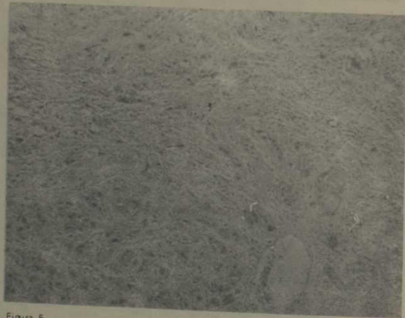
Figura 5. Adenocarcinoma vesicular. Porción escamosa del tumor.