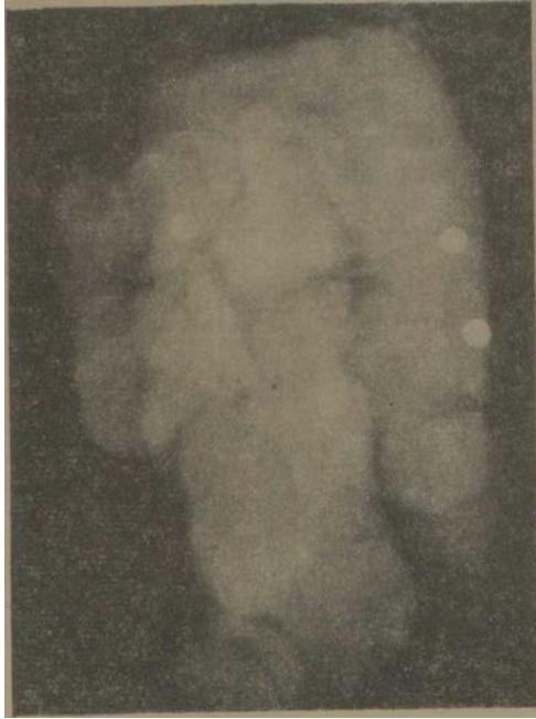
Figura. Medición del tiempo de tránsito intestinal. Nótese que en una misma deposición, el paciente expulsó 3 de las 8 perlas deglutidas.

todo original de Hinton y colaboradores . 19 La detección de las perlas excretadas se hizo mediante radiografía realizadas a las muestras de heces fecales de los pacientes.