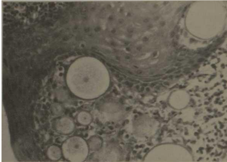
Fig. 3.—A gran aumento, donde se ven varios esporangios,