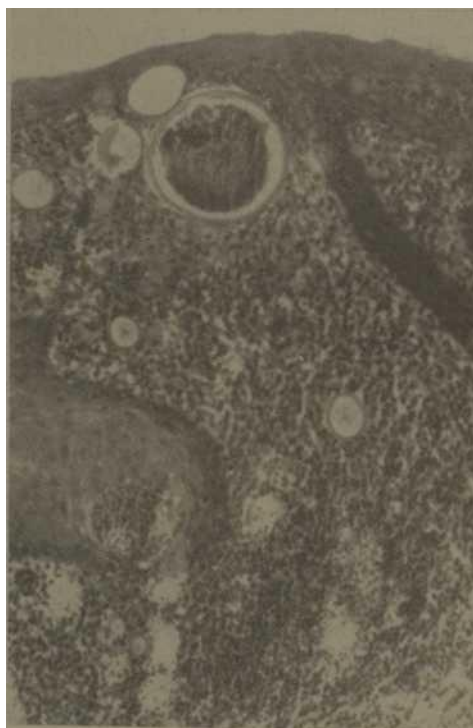
Fig. 1. - Obsérvese un esporangio y otros de menor tamaño infiltrado granulomatoso en dermis interior y medio.

11 de septiembre de 1969: Operación bien. No molestias. Se indican lentes.