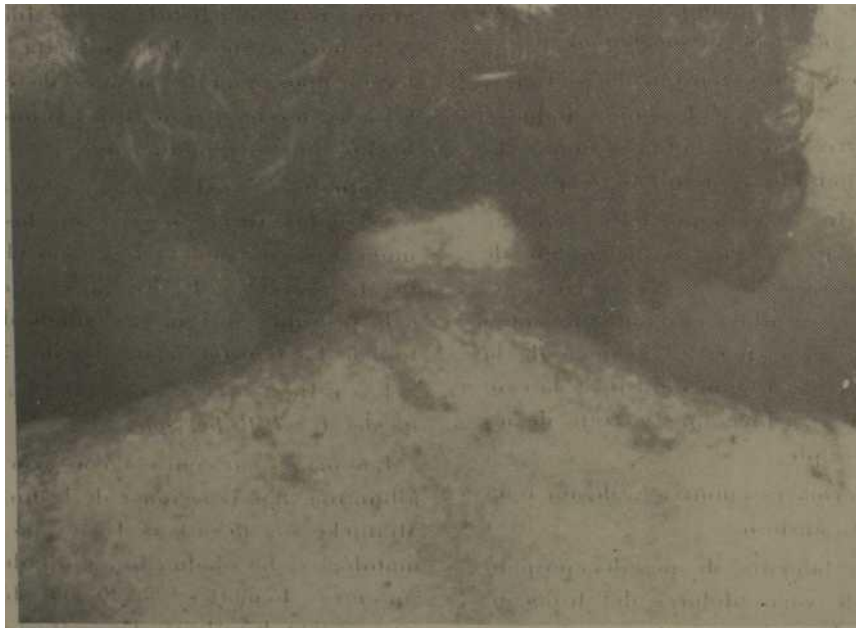
Fig. 2. - Prurigo nigricans pluriiforme (Obs. II).

Las orinas no contienen ni azúcar 111 albúmina. La serología (Kahn y Mei- nicke) son enteramente negativas. Glu