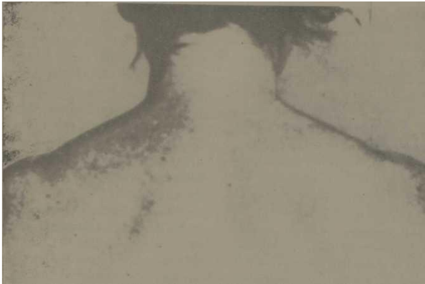
Fig. 1— Prurigo nigricans ptiriasiforme (Obs. I).

Otras, al contrario, son excoriadas, recubiertas de costras. Ellas aparecen quemadas por el rascado. Estas costras dejan, cuando la pápula se reabsorbe, pequeñas lesiones acrómicas, del tamaño de una cabeza de alfiler, de aspecto cicatricial.