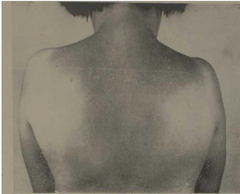
Figs. 1 y 2. – Obsérvese la pigmentación y las lesiones interescapulares iguales en las dos hermanas gemelas de nuestros casos clínicos.