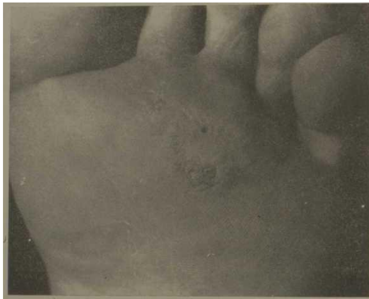
1.—Se observan numerosas verrugas.

Las verrugas individualmente son numerosas y pueden a veces presentar-