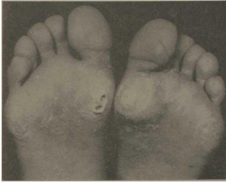
Fig. 2.—Verruga tipo madre e hija. Nótese la localización selectiva de la misma y su disposición.