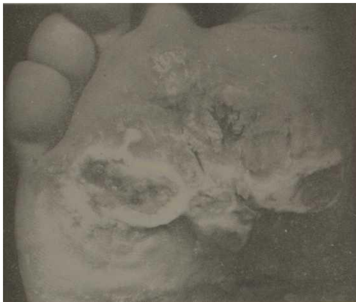
Fig. 4.—Nótese grupos (le verrugas bien delimitadas y separadas por septo de las vecinas.

de Kosbner ) y la transmisión venérea de las verrugas genitales (condilomas acuminados) son muestras adicionales de la naturaleza contagiosa de la enfermedad.