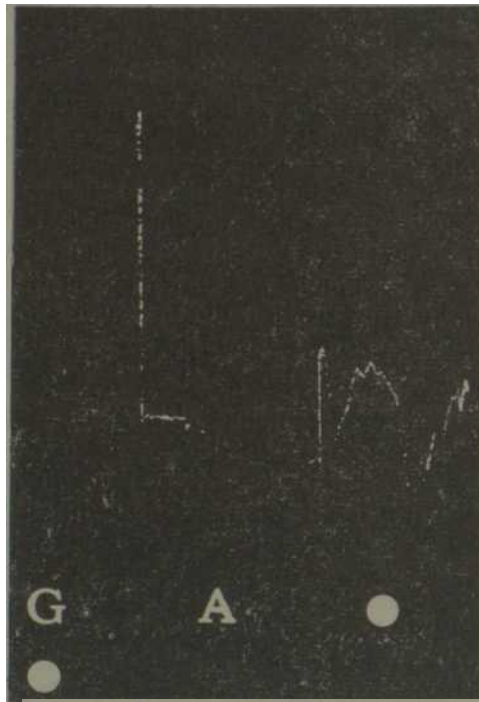
Figura 4. Cambios en la presión arterial: G - galantamina. A - atropina.