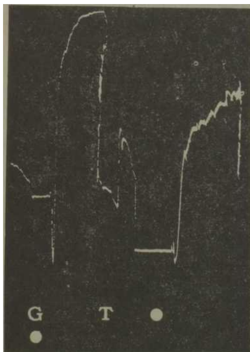
Figura 2. Cambios en la presión arterial: G - galantamina. T - tiamenidina.